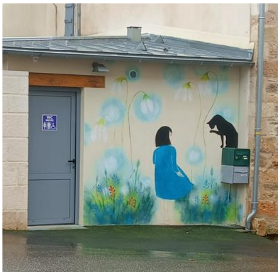
Un accès aux toilettes publiques mis en valeur

Des fresques, dans le but d'enjoliver 2 espaces nécessaires mais un peu ternes, ont été réalisées sur les murs des toilettes et la cabine téléphonique, qui sert aussi de boîte à livres. Le projet a été réalisé par l'atelier d'Anna, artiste domicilié au Bourg.