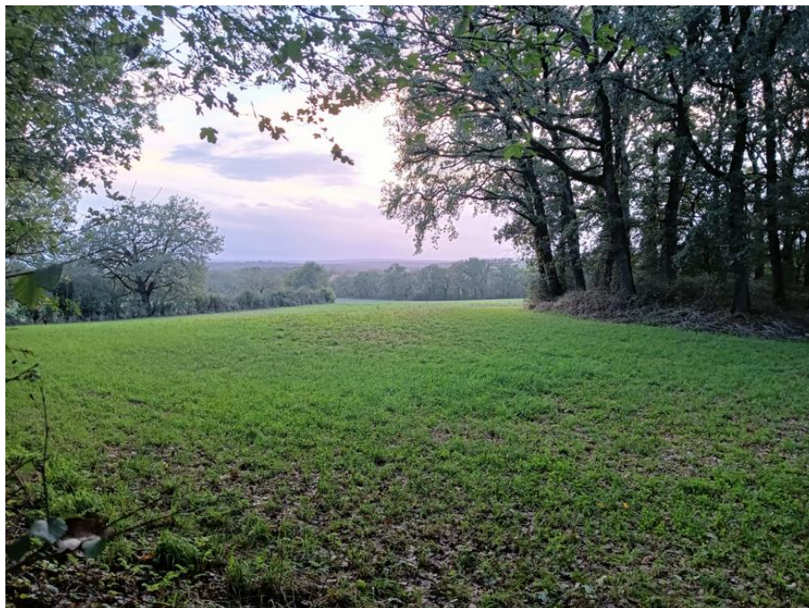
Vue sur la campagne théminoise depuis les ruines de l'église de la Madeleine