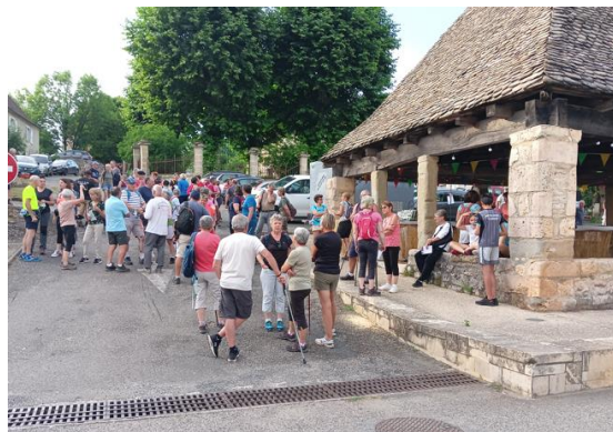
Les marcheurs en attente du départ

Les balades au coucher du soleil du pays de Figeac, ont recommencé, le jeudi 6 juillet, par la commune de Thémines. Les associations sportives théminoises, Nordic46 et Sport détente, ont secondé la municipalité pour le balisage du parcours et l'encadrement. A 20h, plus de 100 marcheurs se sont élancés de la halle. La balade conduisait les marcheurs, des rues du village aux chemins du causse, en passant par les pertes de l'Ouyse. Les participants, à leur arrivée, se sont vus proposer un encas sous la halle. Le parcours de 7km se trouve sur le site internet de la commune.