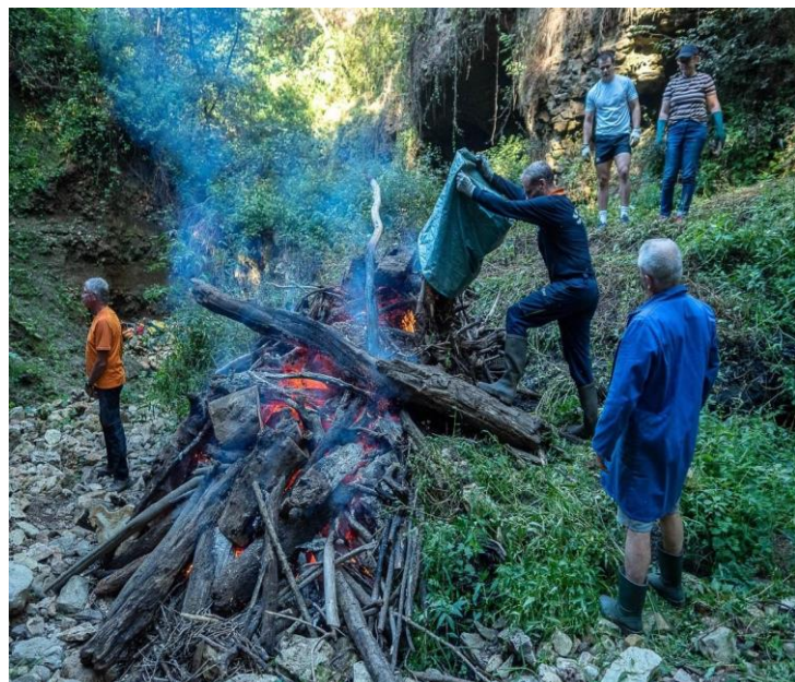
Pas de menu sans braises...