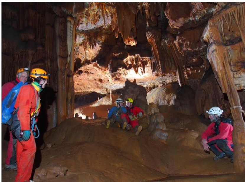
Le club au Fennet au printemps 2023

Pour autant, certaines de ces mises en bouche furent très conviviales