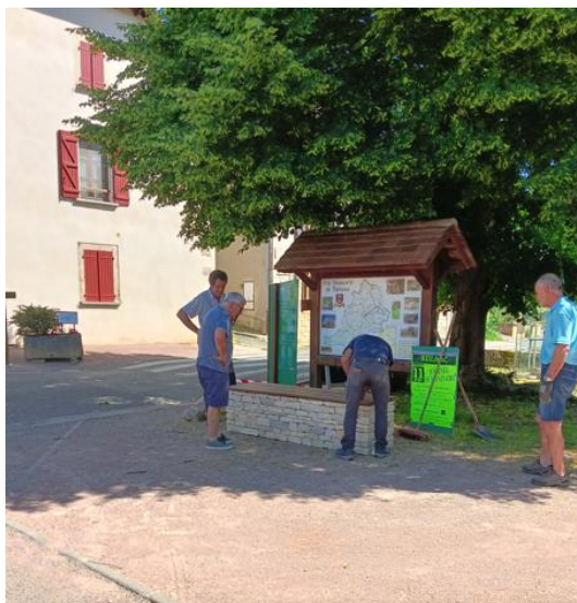
Installation du banc par les fabricants, en présence du transporteur

L'entreprise PFA, installée à la carrière de Thémines a fabriquée et installée un banc en parement de pierres du Lot naturelles face à la mairie. Ce banc est apprécié des marcheurs, qui s'y installent pour admirer la halle.