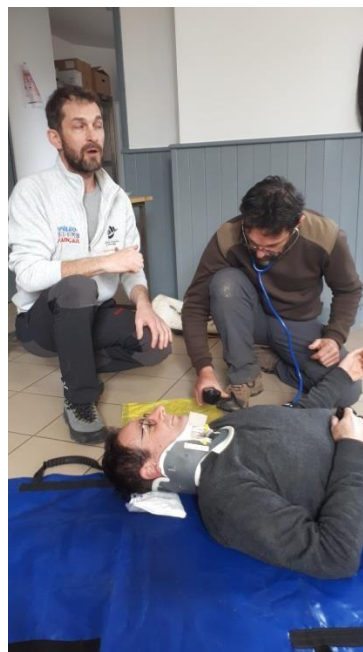
Formation Assistance et Secours à Victime (ASV) à Thémines en janvier 2023.