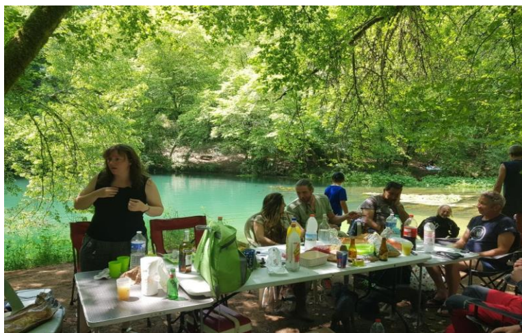
Sortie spéléo plongée et initiations ... bon là, c'est plutôt « l'after » ...