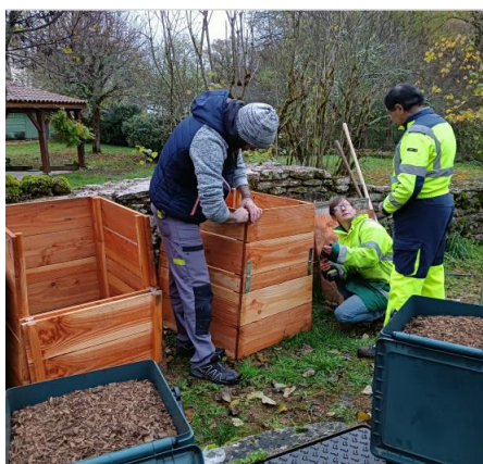
Montage des composteurs par l'agent du SYDED avec l'aide de l'employé communal et d'un habitant

Depuis le 1er janvier 2024, le recyclage des déchets organiques est obligatoire. Pour permettre l'application de cette obligation, la municipalité a doté les logements municipaux mais aussi les logements privés ne disposant pas de terrain, d'un composteur collectif. Dix logements sont potentiellement utilisateurs de ce composteur. Celui-ci est installé au bout de la rue des gouffres.